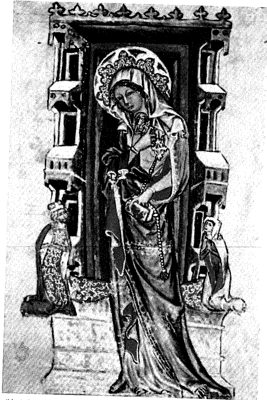
Abb. 1: Darstellung der Hl. Hedwig aus dem Hedwigs-Codex von 1353, fol. 12v.