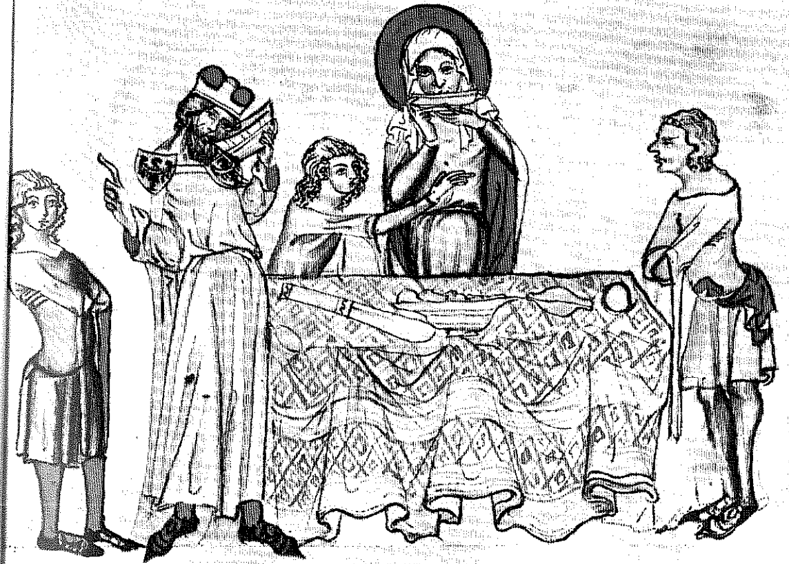
Abb. 2: Herzog Heinrich kostet das in Wein verwandelte Wasser. Hedwigs-Codex von 1353 fol. 30v.

(Abb. 2). Man braucht etwas Phantasie, um bei dem Gefäß, das Herzog Heinrich auf der Abbildung aus dem 14. Jahrhundert zum Munde führt, an einen Hedwigsbecher zu denken. Gab es wirklich eine Beziehung der Becher, die uns hier interessieren, zu der historischen Hedwig von Andechs – oder ist auch diese Überlieferung nur Legende?